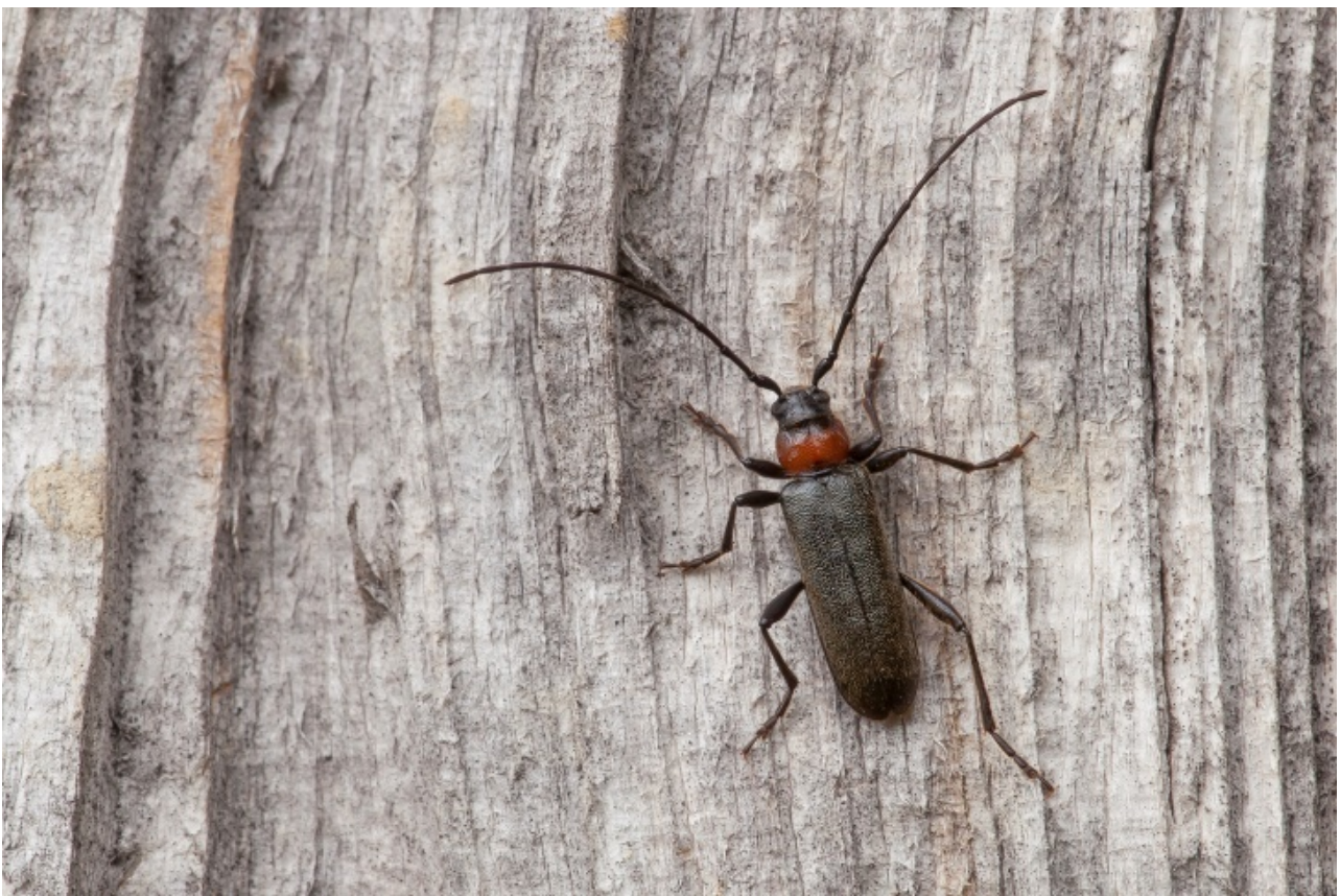
Ryc. 2. Pronocera angusta (KRIECHB.) na stanowisku Toporzysko, fot. Paweł NIENIEC.