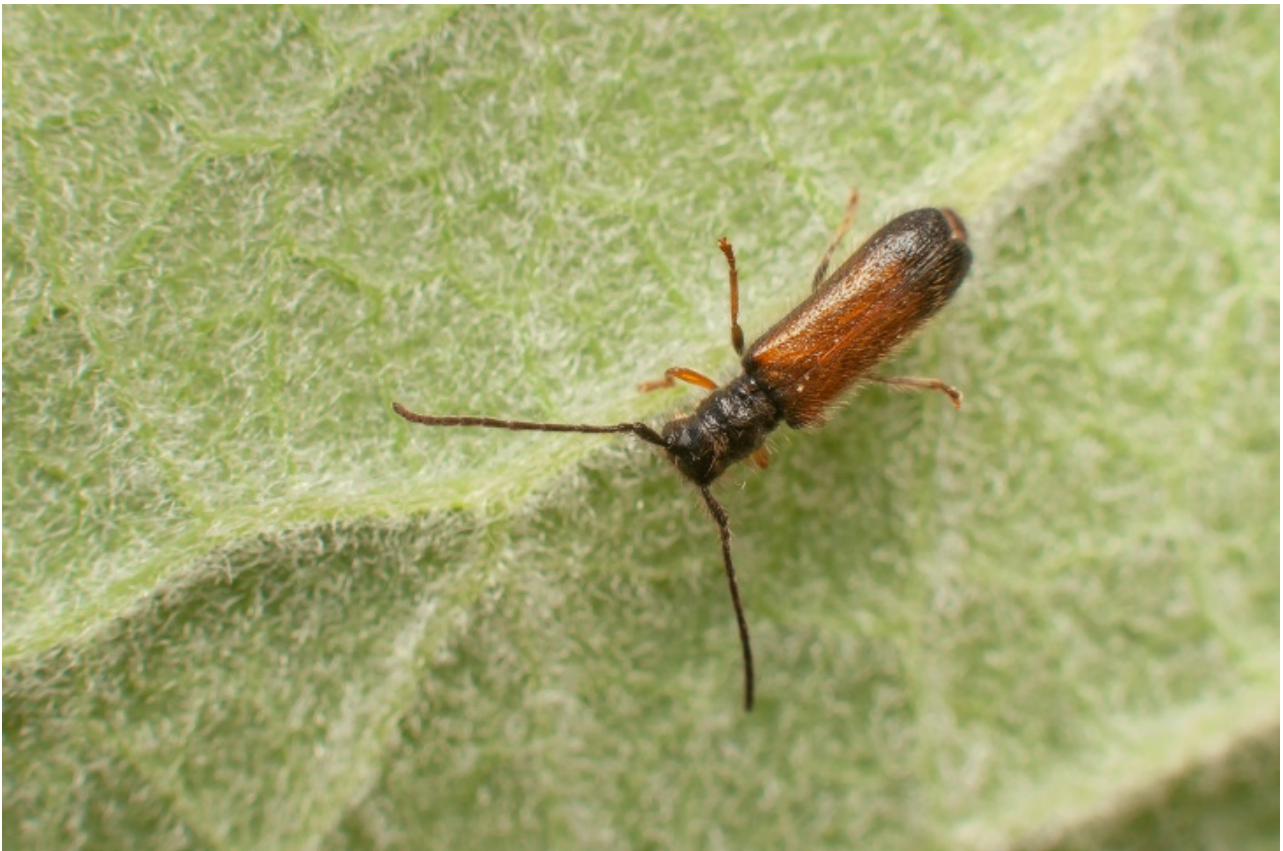
Ryc. 3. Tetrops starkii (CHEVR.) na stanowisku Toporzysko.

We wschodniej Polsce znany dotychczas tylko z trzech stanowisk: pierwsze na Wyżynie Lubelskiej (GUTOWSKI i in. 1999), drugie w Puszczy Piskiej (GUTOWSKI i in. 2010), trzecie w Bieszczadach (MAPA BIORÓŻNORODNOŚCI 2021).